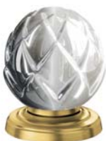
(.021-41) матовое золото gold matt