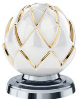
(.000-32) белый/золото (24 К) white/gold (24 C)