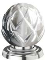
(.035-41) серебристый никель polished nickel