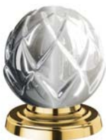
(.020-41) золото gold