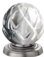
(.066-41) матовая платина platinum matt