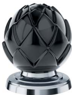
(.000-35) черный black