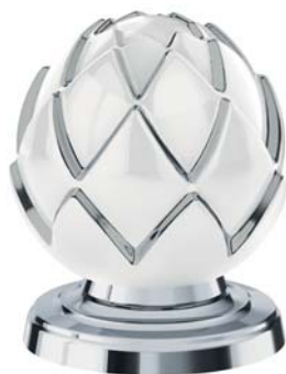
(.000-33) белый/платина white/platinum