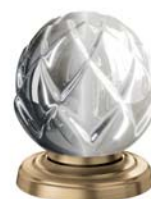
(.041-41) матовая латунь sunshine matt