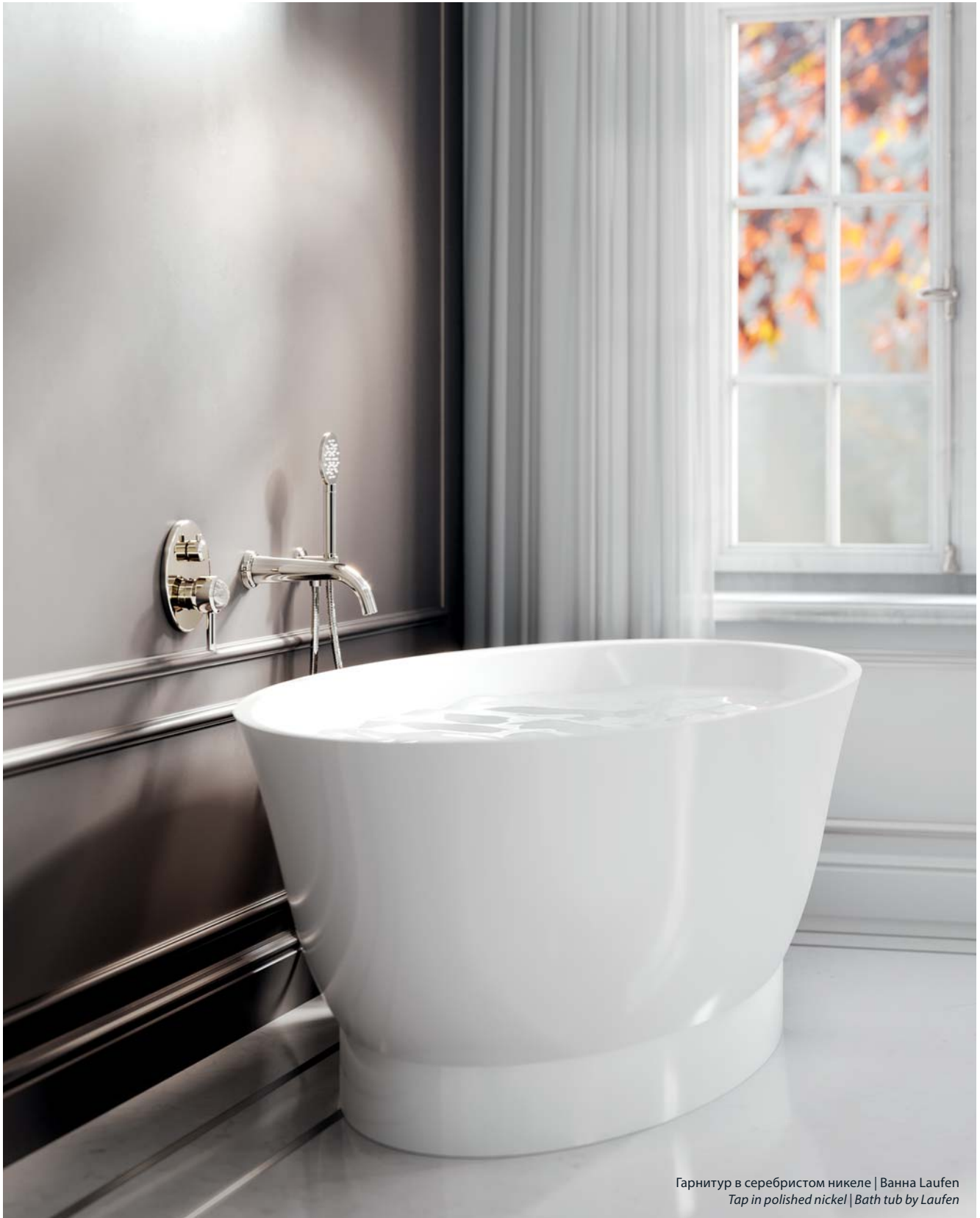
Гарнитур в серебристом никеле | Ванна Laufen Tap in polished nickel | Bath tub by Laufen