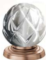
(.023-41) матовое розовое золото rose gold matt