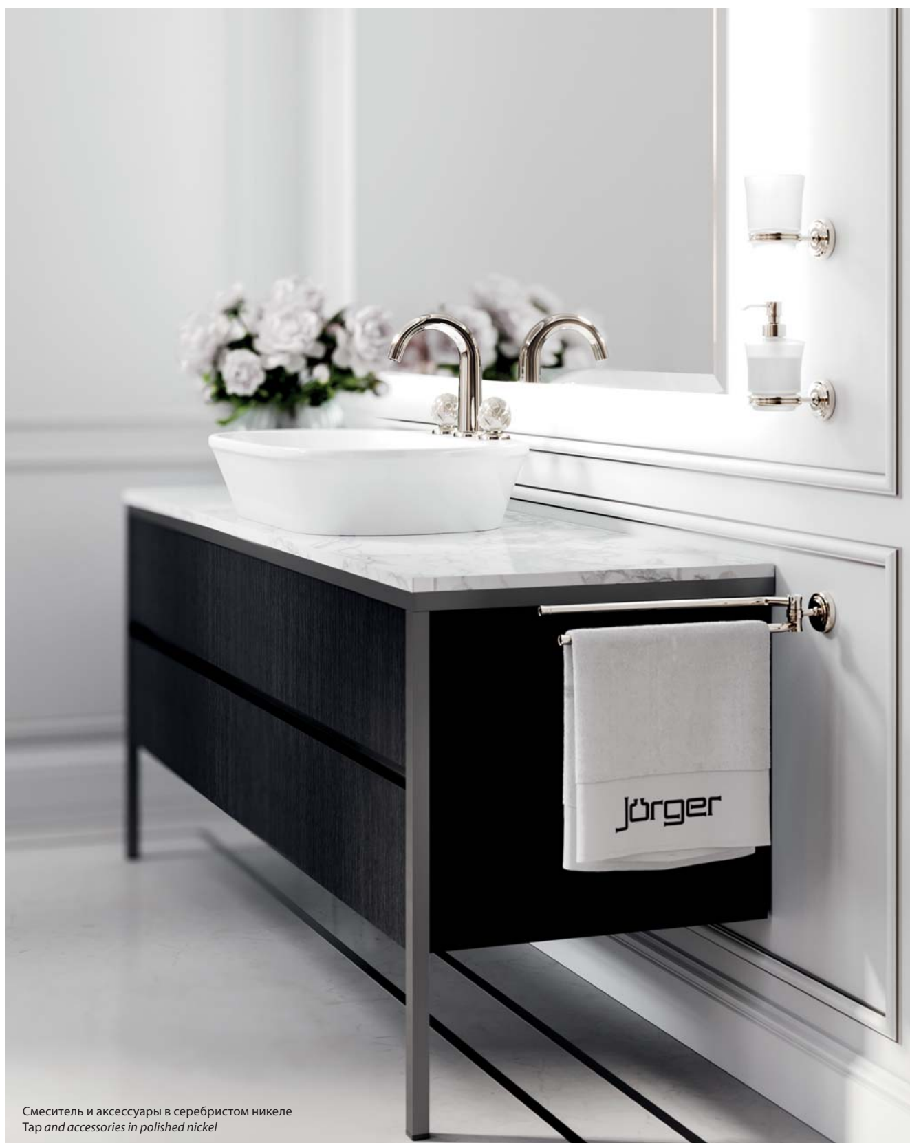
Смеситель и аксессуары в серебристом никеле Tap and accessories in polished nickel