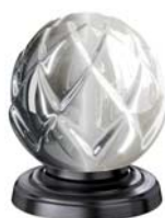
(.096-41) матовый зеркал mirror matt