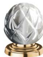
(.040-41) благородная латунь sunshine