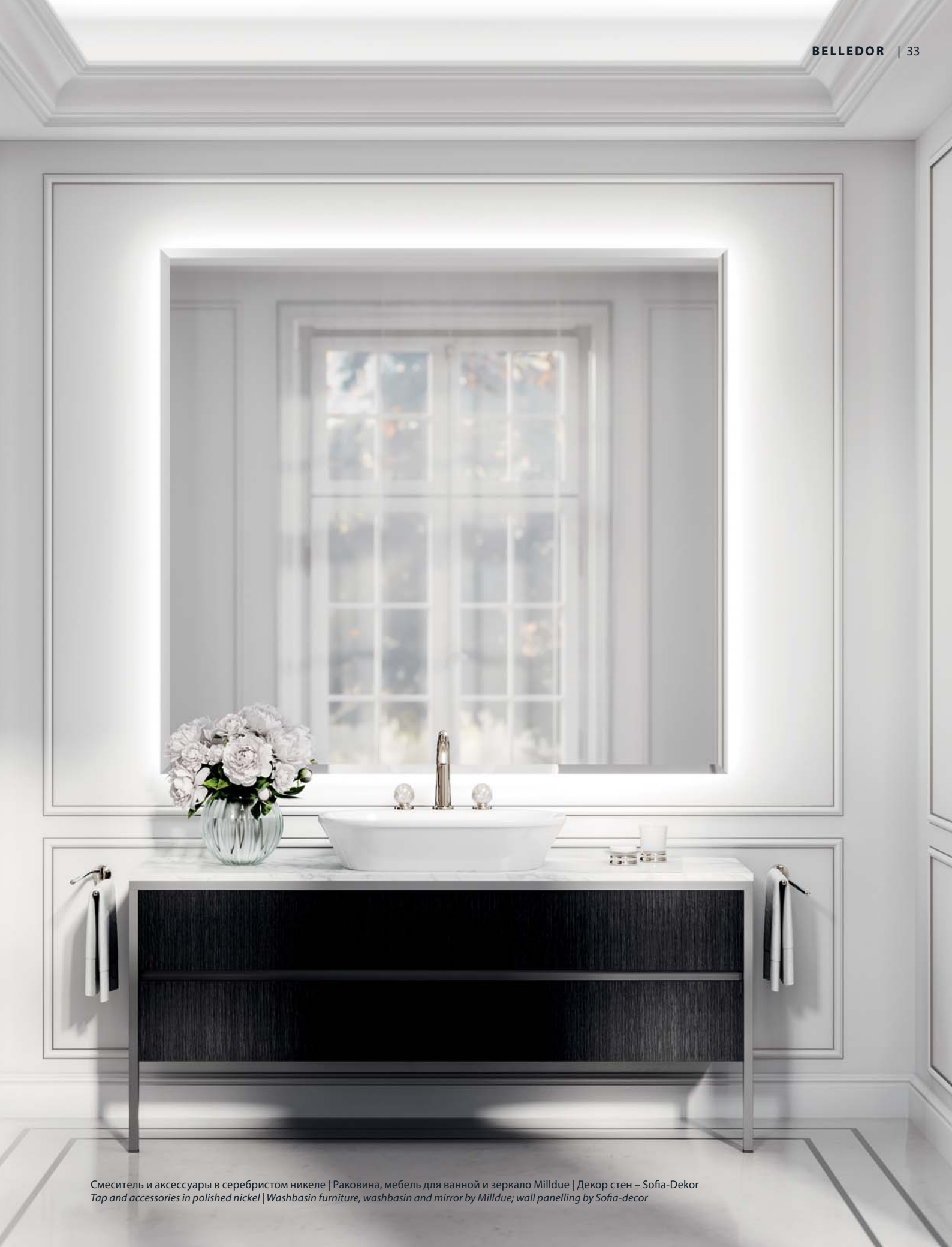
Смеситель и аксессуары в серебристом никеле | Раковина, мебель для ванной и зеркало Milldue | Декор стен – Sofia-Dekor Tap and accessories in polished nickel | Washbasin furniture, washbasin and mirror by Milldue; wall panelling by Sofia-decor