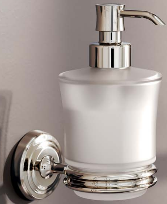
Дозатор и полотенцедержатель в серебристом никеле Soap dispenser and towel bar in polished nickel