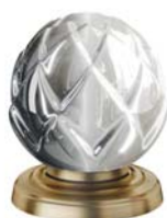
(.011-41) бронза bronze