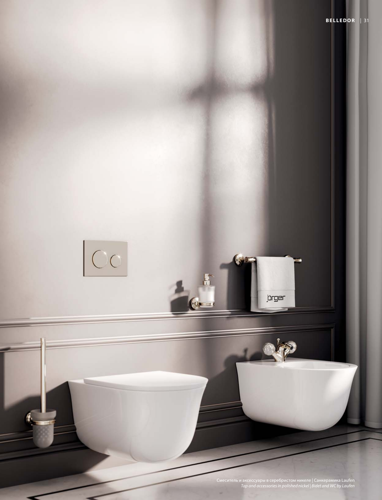
Смеситель и аксессуары в серебристом никеле | Санкерамика Laufen Tap and accessories in polished nickel | Bidet and WC by Laufen