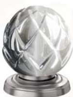
(.036-41) матовый никель satin nickel