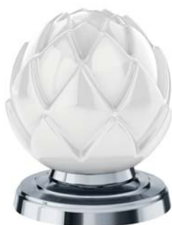
(.000-31) белый white

BELLEDDOR WITH TEN AVAILABLE PORCELAIN HANDLES