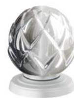
(.052-41) белый матовый white matt