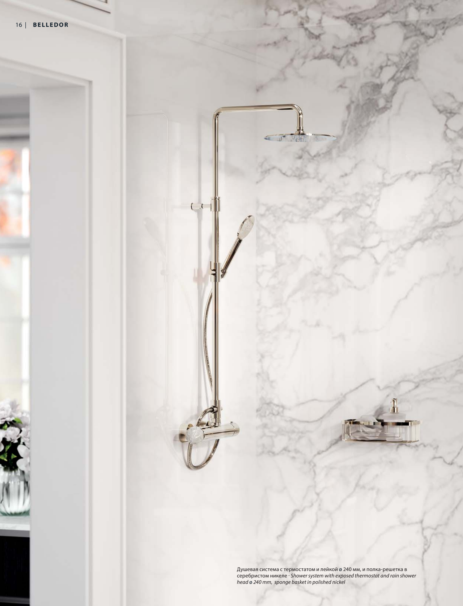
Душевая система с термостатом и лейкой \varnothing 240 мм, и полка-решетка в серебристом никеле · Shower system with exposed thermostat and rain shower head \varnothing 240 mm, sponge basket in polished nickel