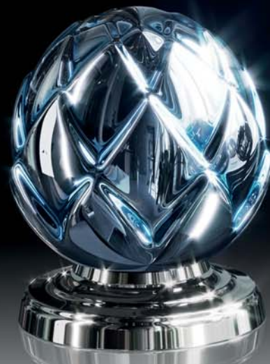
(.000-44) хром/лазурный chrome/azure blue