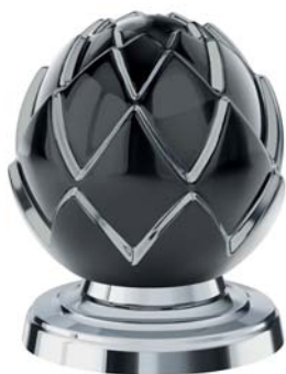
(.000-37) черный/платина black/platinum