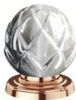
(.022-41) розовое золото rose gold