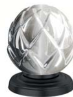
(.092-41) черный матовый black matt