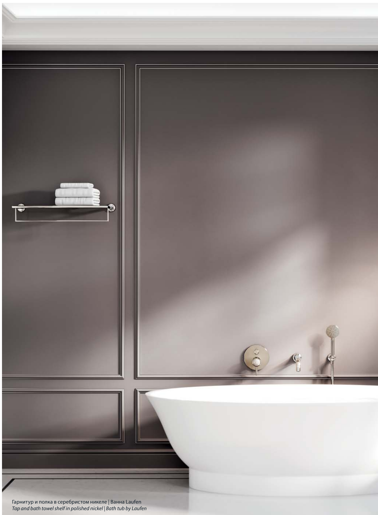
Гарнитур и полка в серебристом никеле | Ванна Laufen Tap and bath towel shelf in polished nickel | Bath tub by Laufen