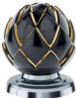
(.000-36) черный/золото (24 К) black/gold (24 C)